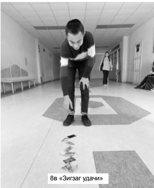
8в «Зигзаг удачи»