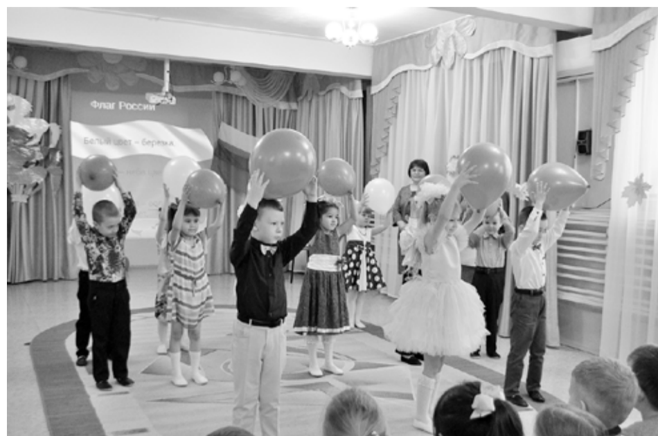
С историей не спорят, С историей живут. Она объединяет На подвиг и на труд.

День народного единства – это праздник, о котором дети должны знать с раннего возраста. Он призывает людей не только вспомнить важнейшие исторические события, но и напомнить гражданам многонациональной страны важность сплочения. Ведь только вместе, двигаясь в одном направлении можно справиться с трудностями и преодолеть препятствия.