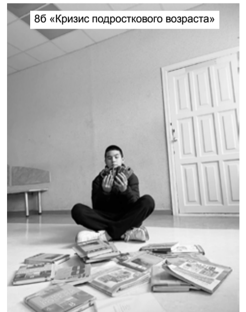
8б «Кризис подросткового возраста»