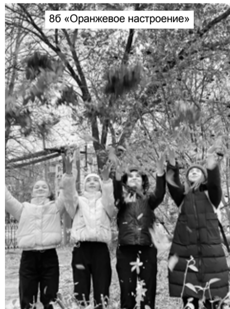
8б «Оранжевое настроение»