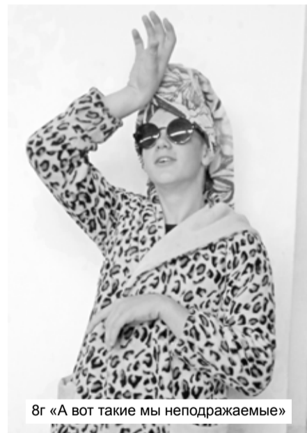
8г «А вот такие мы неподражаемые»